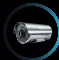
SISTEMAS IP FIJOS DE ALTA DEFINICIÓN COMPLETA

La cámara está equipada con la tecnología SureVision, que ofrece rendimiento en condiciones de poca luz y WDR, por lo que proporciona a los operadores evidencia nítida y clara en las difíciles condiciones de iluminación típicas de las áreas peligrosas. El vari-zoom IR proporciona una iluminación constante en todo el acercamiento de la cámara y de esta manera brinda una visualización óptima en situaciones de poca luz.