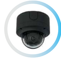
OPTERA® 180° 270° 360°