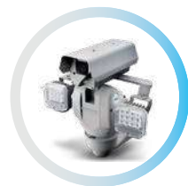
SISTEMA DE POSICIONAMIENTO