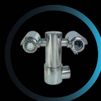
OPCIÓN DE ILUMINACIÓN PTZ E INFRARROJA