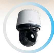
IR Y 4K