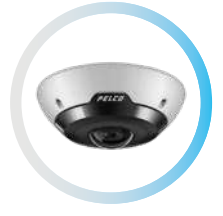
FISHEYE 8 MP / 12MP SURFACE MOUNT