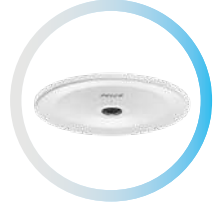
FISHEYE 8 MP / 12MP IN-CEILING MOUNT