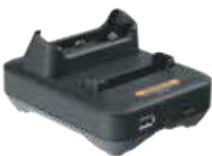
BASE DESKSET INDIVIDUAL

NO AMINORE LA MARCHA... SIMPLEMENTE REEMPLACE LA BATERÍA AGOTADA POR UNA NUEVA