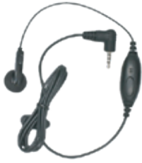
AUDÍFONO DE 3,5 MM CON PTT Y MICRÓFONO EN LÍNEA