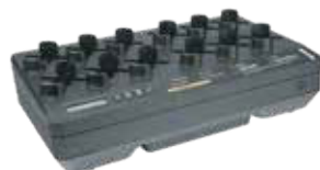
CARGADOR DE UNIDADES MÚLTIPLES

Cargue el LEX L11 y la batería de repuesto al mismo tiempo