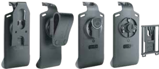
SOPORTE PARA LEX L11 CON TECNOLOGÍA DE ENRUTAMIENTO DE AUDIO