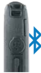
ADMITE ACCESORIOS BLUETOOTH Y DE 3,5 MM DE OTROS PROVEEDORES