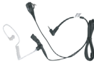
AURICULAR DE DOS CABLES DE 3,5 MM CON TUBO TRANSLÚCIDO