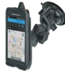
BASE PARA VEHÍCULO